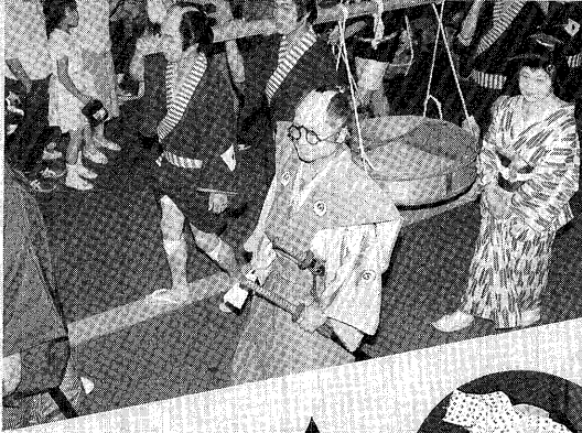
▼町長彦左と一心大助の女房お仲さん