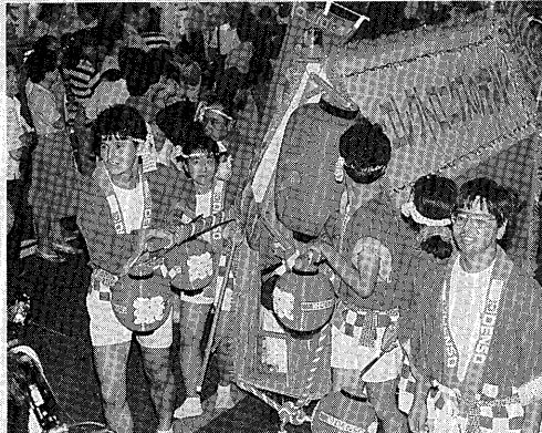
▲応援隊の参加で祭気分も最高潮