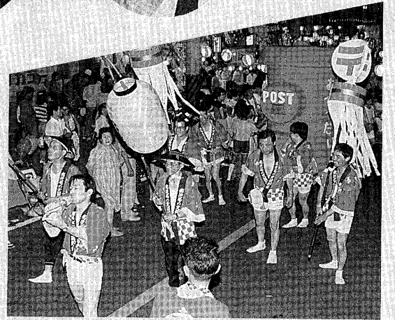
▲ほら貝の音色が夜空に響き渡ります