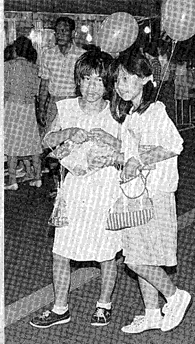
▲「おもしろかったね」「来年も来ようね」