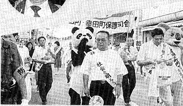
▲社会を明るくする運動に参加する保護司会